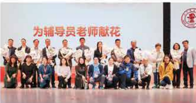
时任辅导员第十一个院系辅导员老师们共同走上舞台 依然追忆了当年美好的师生生活 校友联络站登台为老师们献上鲜花