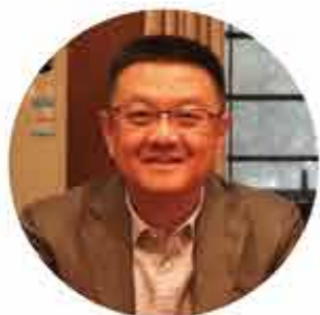
89届校友 北京市委组织部副部长 闫成

自己一直以来牢记饮水思源的教导，感恩母校培养。他对母校发展提出了三点建议：1、在育人方面贯彻知行合一的理念，增加实践教学；2、进一步加强优绩学科群的建设；3、加强学生思想政治教育，培养家国情怀。