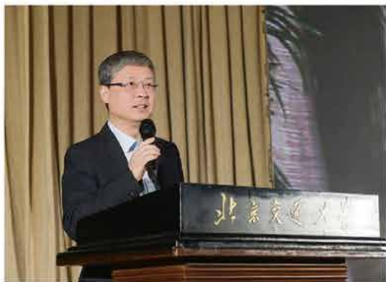
党委书记 黄泰岩 在89届校友值年返校大会会场致辞

10月19日，迎着和煦的秋风、带着丹桂的飘香，伴着祖国七十岁生日的赞歌，近四千名89、99、09届校友们荣归红果园，畅议青春岁月、感慨母校巨变，共叙师生情谊，共话事业发展。