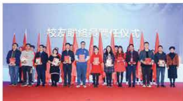
会上举行了校友联络员聘任仪式和值年活动交接仪式。