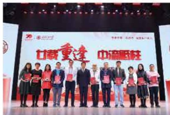
大会举行了校友联络员聘任仪式和毕业周年纪念活动交接仪式