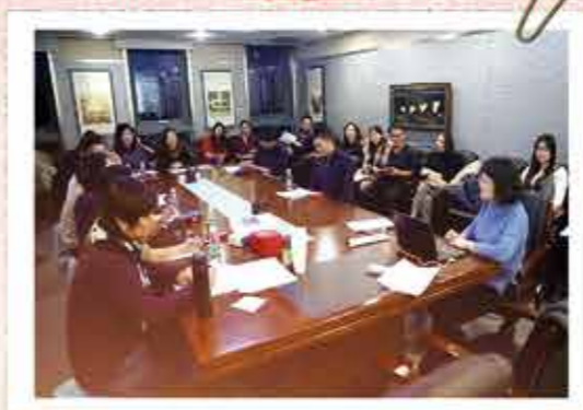
09届联络员第一次会议