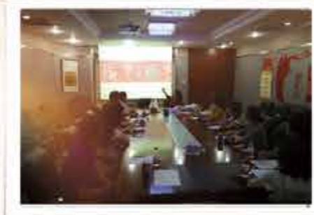
09届返校联络员第三次会议