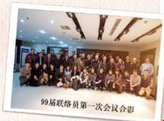
99届联络员第一次会议合影