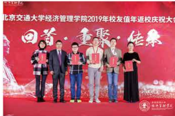
北京交通大学经济管理学院2019年校友值年返校庆祝大会