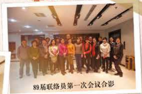
89届联络员第一次会议合影