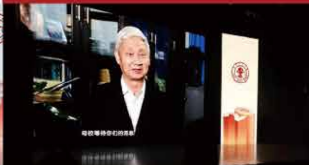
北京交通大学原校长谈振辉现场通过视频致辞大会