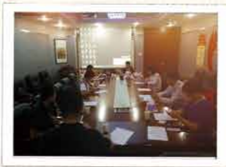
99届返校联络员第三次会议