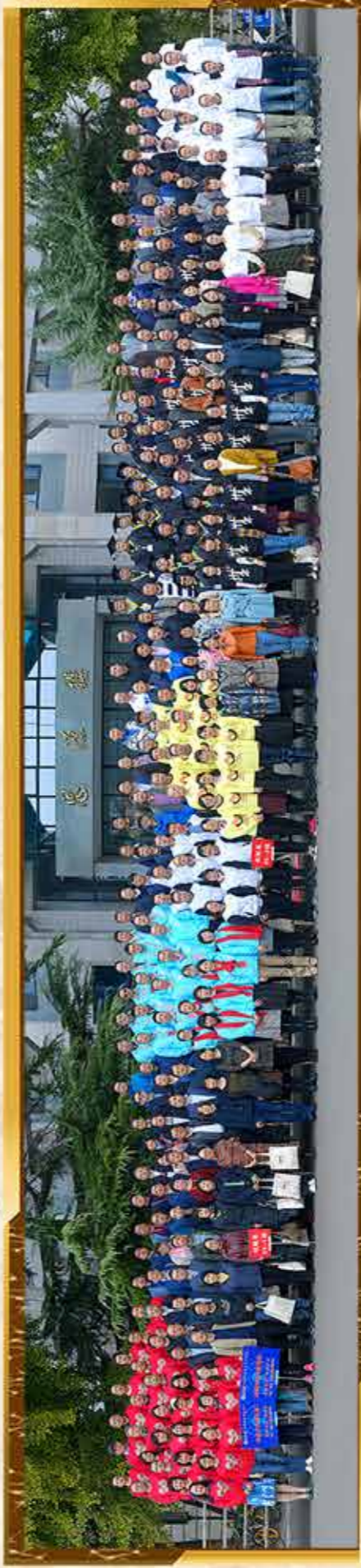
89届校友毕业30年返校合影