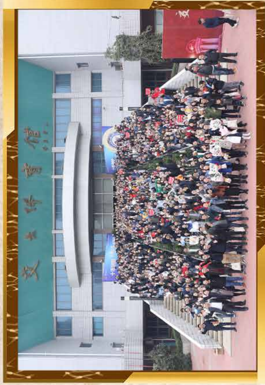
09届校友毕业10年返校合影