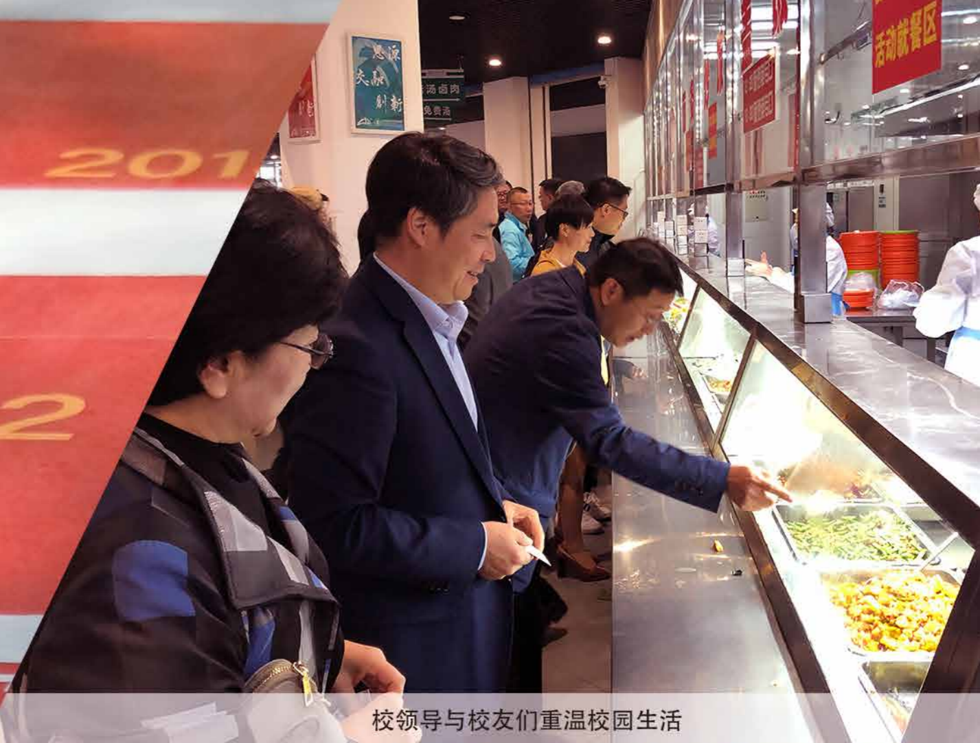
校领导与校友们重温校园生活

我是现役海军。现在觉得学校变化很大。国家现在高铁这么发达，铁路发展这么好，我也很自豪。我注意到学校的综合排名，咱们学校现在运输专业好像是全球排名第一，我女儿有个同学，报了加州伯克利的这个专业，我一看这个专业是全球排名第二，全球排名第一是我们学校，我特别高兴。然后我们学校还有一个消息，是这个网络安全（专业）成立了。这个专业刚出现，我们学校就能有（这个专业），证明我们学校的科研实力是很强的。