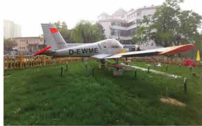
交通运输学院 90 级校友李峻和 89 级校友刘伟捐赠一架飞机