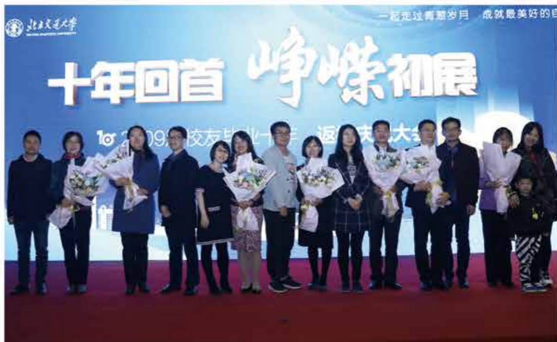
当年曾任电信学院等七个学院的辅导员和教师上台发言，表达了对校友的祝福和师生感情的怀念。