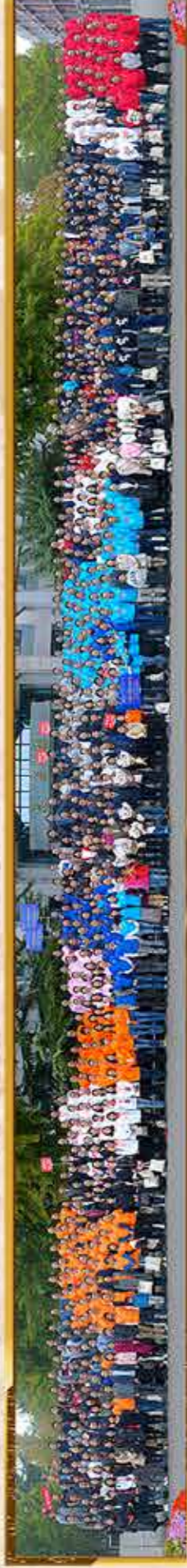
99届校友毕业20年返校合影